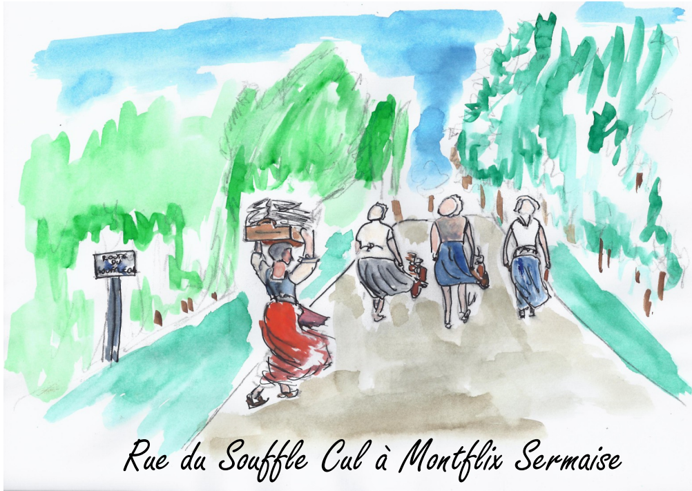
Rue du Souffle Cul à Montflix Sermaise