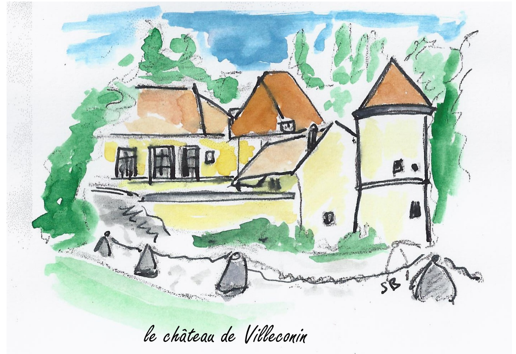
le château de Villeconin

D'un passé historique fort riche, la commune comporte une église du XIII ème siècle, l'église Saint Aubin, et trois châteaux : le château de Villeconin du XIV ème siècle, le château de Saudreville du XVII ème siècle et enfin le château de la Grange édifié au XIII ème et fin XV ème siècle.